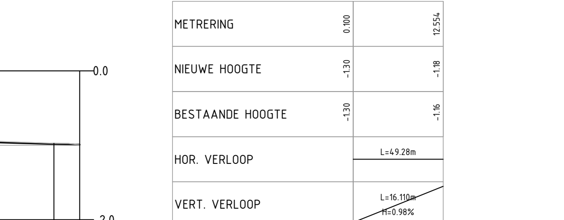
LENGTEPROFIEL T.P.V. ALM - Rijbaan Edisonstraat HOR. SCHAAL 1 : 500 VERT. SCHAAL 1 : 50